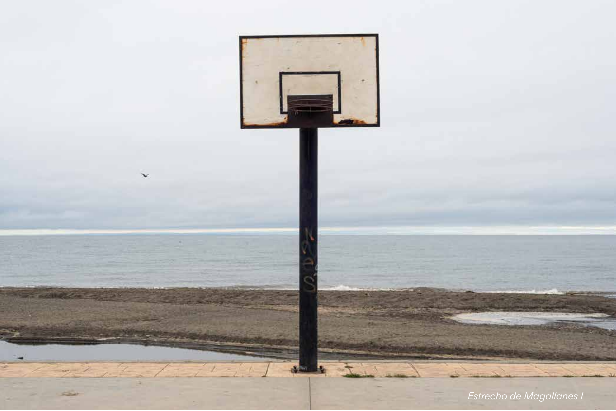
Estrecho de Magallanes I